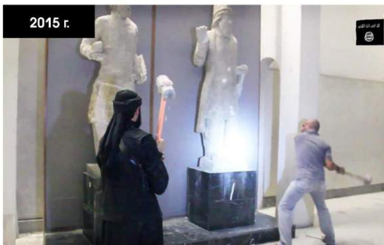
Video from ISIS